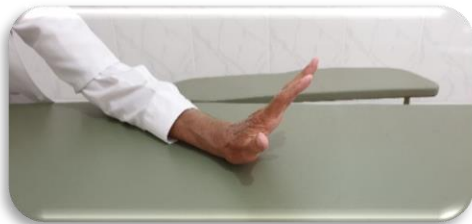
Fig. 2 – Posição da mão

Este apoio se faz com o « calcanhar » do punho, dedos em extensão, diretamente sobre o osso* e de maneira simultânea a uma tração axial da cabeça e do pescoço, graças à outra mão, situada sob o occipital (Fig. 2, Fig. 3).