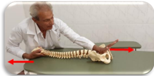
Fig. 3 – Tração do occipital e repulsão do púbis

Esta repulsão da sínfise pubiana pode ser efetuada, segundo o caso, em qualquer nível de alongamento dos membros inferiores. Seu objetivo é de chegar a recriar uma lordose lombar normal, sem perder a tensão global.