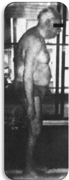
Fig. 1 – Retroversão da pelve, retificação lombar, antepulsão da cabeça.

A manutenção em tração global de alongamento é garantida pelos progressos realizados em tracionamento da cabeça e do pescoço e graças à supressão progressiva dos calços suboccipitais, assim como pelos alongamentos além das fronteiras de rigidez, realizados no nível dos membros inferiores.